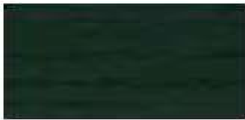
タンネングリーン (45-20B)